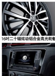
16吋二十辐炫动铝合金高光轮毂